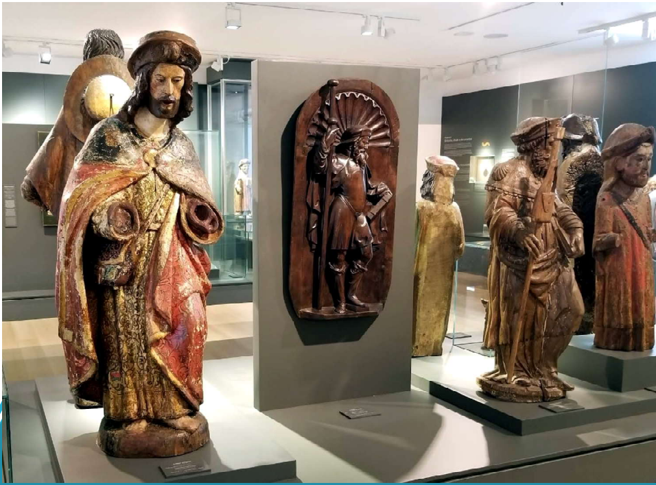
Pellegrini, Santiago de Compostela, Museo della cattedrale, da Google maps, foto di Wayne Froboese, gennaio 2024.